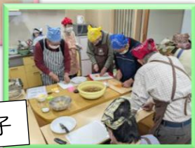
料理している様子