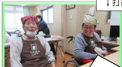
↓ うちわら さん 打藁さん