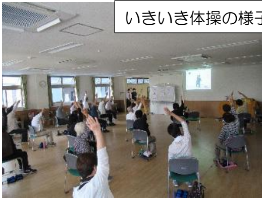
いきいき体操の様子

A、楽しく、笑って過ごせる場所にしたいと思っているんだ。あとは体力維持の場。以前、大学生が参加されたけどしんどいと言っていた。私たちは慣れてるからそうは思わないけど、結構体力を使う体操をしている。最高で1.2kgのおもりを付けて身体を動かしているんだ。やっぱり続けていると体が軽くなっているのか、皆勤している人はゴルフのスコアが伸びたと言っていたよ。週1回みんなの顔をみるとハリも出るし、終わったら食事に行ったり、カフェでお茶をしたりと交流の場にもなっている。体操が始まる前はみんなでお喋りもできて楽しいよ。