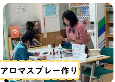
アロマスプレー作り