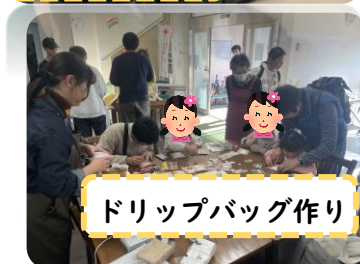
ドリップバッグ作り

『ふれぼので何かやってみたい』という声をきっかけに、立場や年齢の近い方同士の情報交換の場として不定期開催しています。