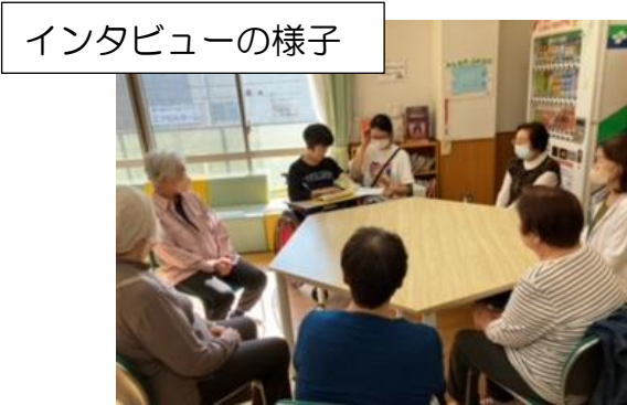
インタビューの様子