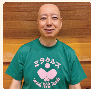
話を聞かせてもらう人

※パラスポーツは、障害者スポーツやユニバーサルスポーツ等さまざまな呼び方があります。