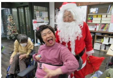
な、なんと!!! 立派なおひげのサンタさん も来てくれたよ!