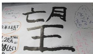
上手に 書けたかな?