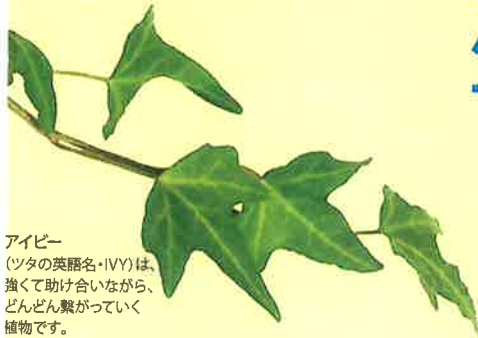
アイビー (ツタの英語名・IVY)は、 進んで助け合いながら、 どんどん繋がっていく 植物です。