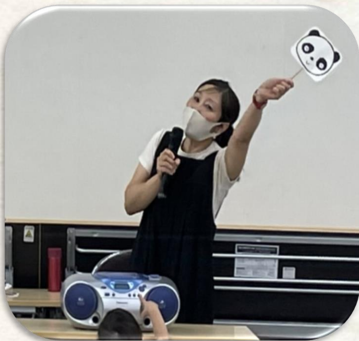
ペープサートの様子