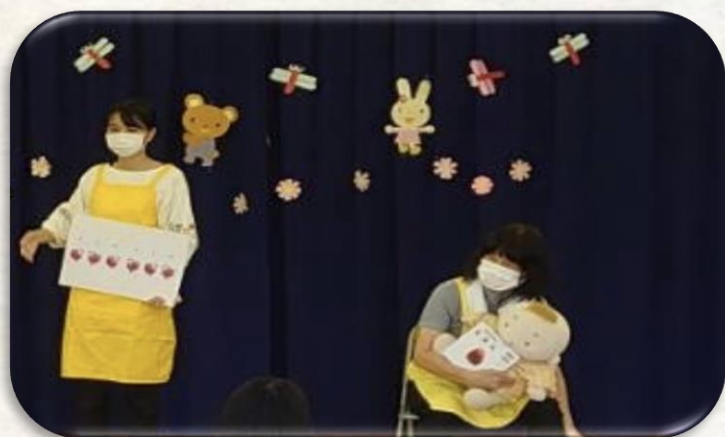
絵本の読み聞かせの様子