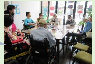
先日お邪魔した 安井地区ボランティアセンター