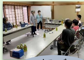
カフェで お客さんとお話中！

今後は月1回のペースで、地域の方との座談会を開催する予定です！開催日時やテーマはふれぼのカフェに掲示します。皆様のご参加をお待ちしています^^