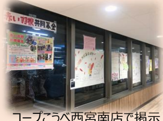
コープこうべ西宮南店で掲示