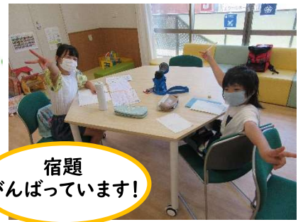
宿題がんばっています!