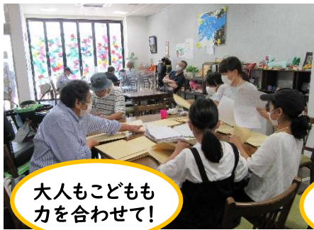
大人も子どもも力を合わせて!

ふれぼの館内は毎日地域の皆さんの元気な声や笑顔であふれています!とってもにぎやかです☆