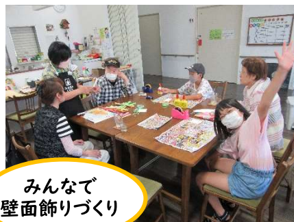
みんなで壁面飾りづくり