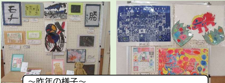
～昨年の様子～ 書道、手芸、絵画など様々な作品が館内を彩りました☆

開催期間は 8 月 18 日(木)～9 月 1 日(日)の予定♪ふれぼのの本人さんや地域の方等の個性溢れる作品を館内に展示するので、ぜひ遊びに来てくださいね☆