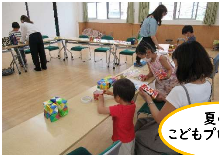
夏の子どもプログラム