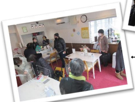
←ほっとできるアットホームな空間