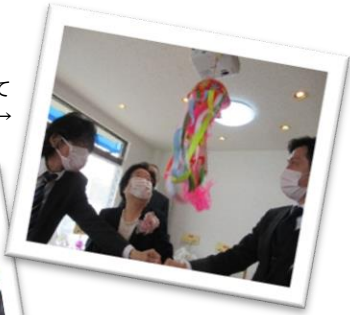
開所式ではくす玉を割ってお祝いました。 →

いよいよ再開すると、休止中に声をかけていたPTAや居場所づくりに興味のある方等様々な世代のメンバーが集まりました。スタッフ企画でフードパントリーを実施するなど、拠点での活動にみなさん胸をおどらせています。ぜひパワー全開のすまいるサロン春風にお越しください。