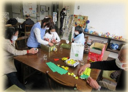
子どもから高齢者、障害のある人など いろいろな人がつどう場 『ふれぼのカフェ』

認知症カフェや子ども食堂、学校に行きづらい子と親の居場所など、多様な形のつどい場づくりにむけて、活動をしたい方の思いに寄り添いながら相談に応じています。また、“いつ行っても誰かいて、気軽にお話しできる”常設の居場所づくり（ 共生型地域交流拠点 ）についてもサポートしています。