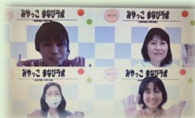
多様なテーマに基づき楽しく 真面目に学び合う機会 『みやっこまなびラボ』を実施

その一つとして、地域で何かやってみたい人や、すでに活動されている人が、世代・立場に関係なく出会い、自由に話し合える場づくりや各々の関心事に合わせた 講座 を開催しています。