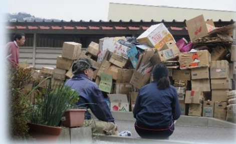
『お片付けサポートプロジェクト』 その方や世帯の状況に応じて、 仕組みを作っていきます

最初に作った仕組みは、ボランティアや専門職等による「お片付けサポートプロジェクト」です。認知症や障がい等によって片付けることが難しい人や世帯に対して、サポートを行うことで住み慣れた地域で暮らし続けられる支援を目指しています。