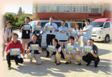
『浜甲トライあぐる』 同じエリア内の事業所や団体が メンバーとなり共に活動

地域課題の解決やよりよい地域づくりを目指して、多様な主体が、 連携・協働するつながりづくり を行っています。地域住民と法人、施設、企業などが一緒になって行う取り組みが市内でも少しずつ生まれています。その一つとして、甲子園浜地区では同じエリア内の社会福祉法人やエリアマネジメントを行う団体等が一つになり『浜甲トライあぐる』を結成しました。団体間の情報共有や、福祉車両が送迎時に見守りをする仕組みづくりなど、よりよい地域づくりにむけてともに活動しています。