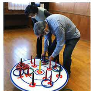
2階では大きな輪なげが好評でした