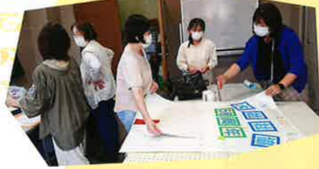
☆写真展の準備作業☆

昨年に引き続き、高齢者を対象にしたイベントを開催しました。お天気にも恵まれ、元気に足を運んでくださった皆さんは若かりし頃の写真やなつかしい写真もあって思い出に話が盛りあがっていました。