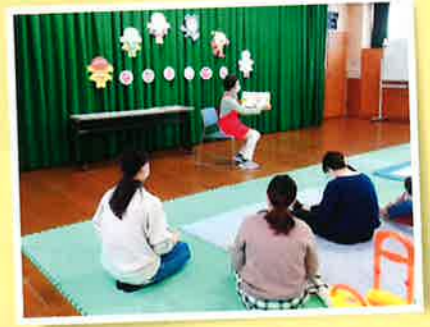
令和3年11月16日 ボランティアさんによる絵本の読み聞かせ

民生委員・児童委員協議会が大社児童センターで始めた「なかよし広場」を平成16年(2004)に社協が引き継ぎ、平成20年(2008)に場所を大社公民館に移しました。 平成23年(2011)には子育て支援部として発足し、お母さん同士のお友達作りの場にもなっています。