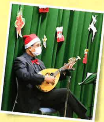
令和3年12月7日 12月のクリスマス会。マンドリンの演奏に合わせて、クリスマスソングを歌いました。

平成20年(2008)に発足。 当初は、大社公民館と夙川老人いこいの家の2か所で開かれていました。 楽器の演奏、うたごえ喫茶、七夕飾りなどのもの作り、おしゃべりやコーヒーとお菓子の時間も楽しんでいただいています。