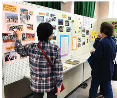
大社協50周年記念の写真展 これまでの行事や部会活動をわかりやすく展示しました