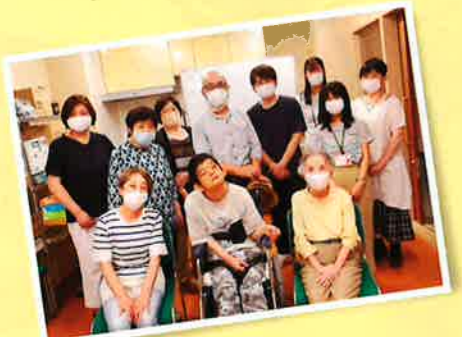
令和3年6月23日 部会では、和やかなひと時を過ごしました。

平成4年(1992)発足。 「障害者父母の会」との懇親会、大社児童センター及び青葉園(重度心身障害者施設)の見学やふれあい交流会などの活動を進めています。 最近では大社小学校のひまわり学級の児童や先生、保護者、また地域在住の障害を持った方たちとの交流をもち、勉強会を行っています。