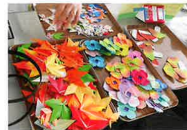
折り紙をたくさん用意して、ご来場の皆様に貼りつけてもらいました(表紙の写真)