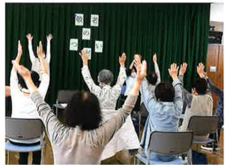
講堂では、体操とクイズで体と頭をリフレッシュ