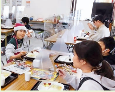
ともだち食堂 クリスマス会

この助成金を活用して普段できない楽しいイベントができ、子どもたちの笑顔を見ることができました。