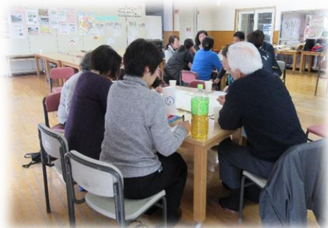
『自分のまちにこんな活動があったらいいな』 を語り合いました

その一つとして、地域で何かやってみたい人や、すでに活動されている人が、世代・立場に関係なく出会い、自由に話し合える場づくりや各地域の関心事に合わせた 人材発掘・養成講座 を開催しています。