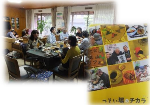
個人宅を活用した「つどい場」/事例集

市内のつどい場の事例集「つどい場のチカラ」を発行するなど、つどい場の魅力や活動者の思いの発信も行っています。