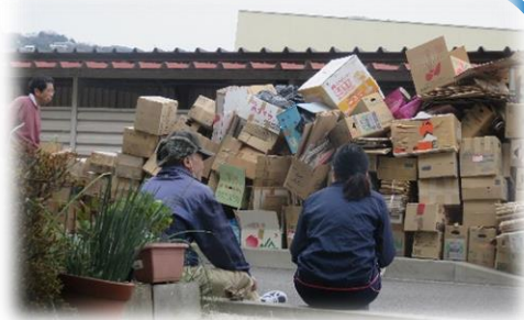
「お片付けサポートプロジェクト」 (※その方や世帯の状況に応じて、 仕組みを作っていきます)

最初に作った仕組みは、ボランティアや専門職等による「お片付けサポートプロジェクト」です。認知症や障がい等によって片付けることが難しい人や世帯に対して、サポートを行うことで住み慣れた地域で暮らし続けられる支援を目指しています。