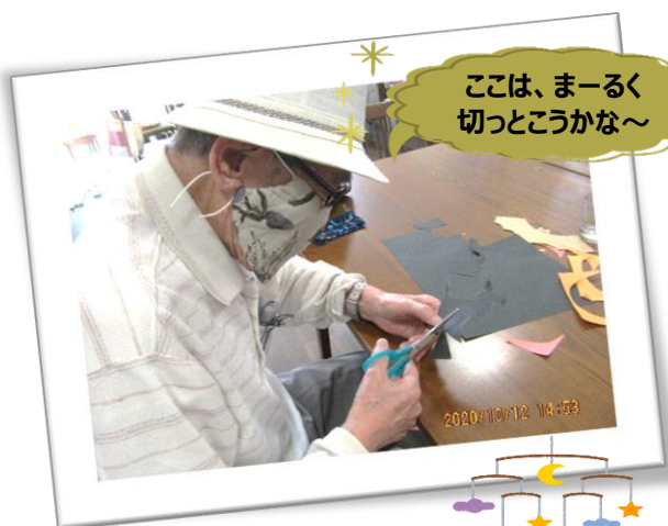
ここは、まーるく切つこうかな〜

ハロウィン当日は、地域の子ども会や青年会議所のイベントが開催され、外巡りの途中に、ふれぼのへたくさんの方が来館されました。