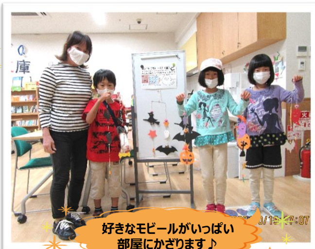
好きなモバイルがいっぱい部屋にかざります♪