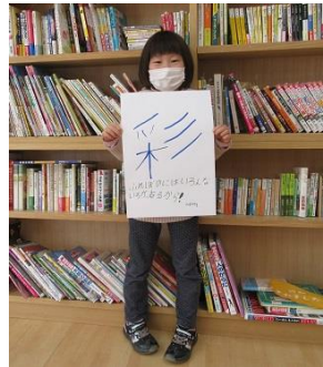
キッズサポーター

ふれぼのは今月、開館3周年を迎えます。3年間で、いろんな出来事や思い出も生まれました。いつも来館してくださっている方々にふれぼのへの思いや感想を、漢字で表現してもらいました！