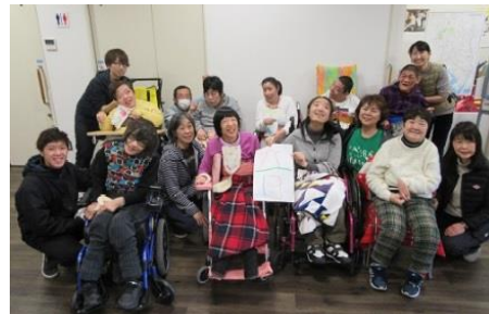
地域活動センターカフェ当番のみんな

勝ったり負けたり将棋を愛する仲間と楽しんで幸せです。子どもからの挑戦も受けてます！