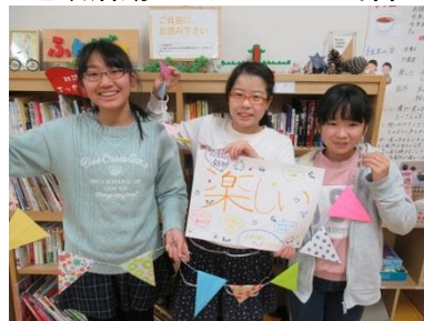
キッズサポーター