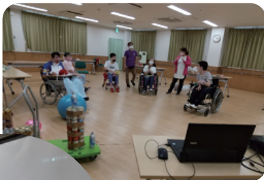
1階の様子を スクリーンに

フィンランドの観光映像が流れる中、入国審査の係員が登場したり、フィンランド航空の機長さんが登場したりして、臨場感あふれる活動でした。