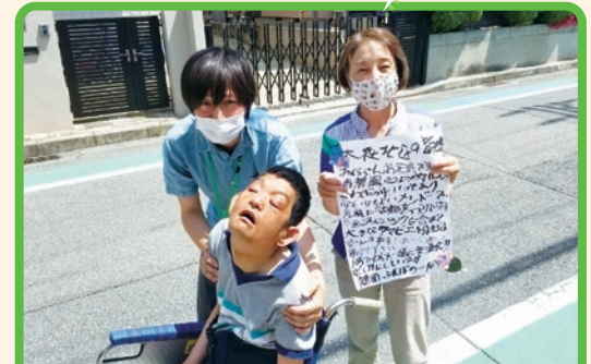
久しぶりに地域の方と会えました!