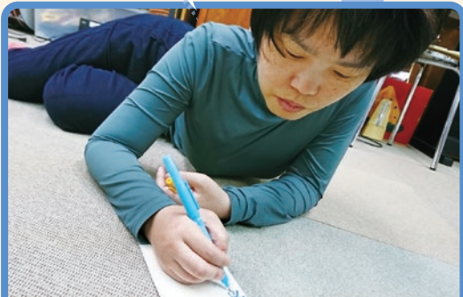
会えなくなった人に手紙を書こう!