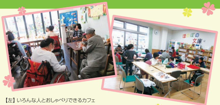
【左】 いろんな人とおしゃべりできるカフェ