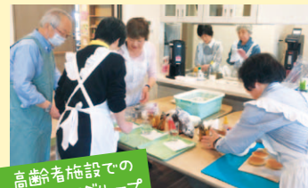
高齢者施設でのボランティアグループ