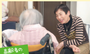
高齢者のお話し相手