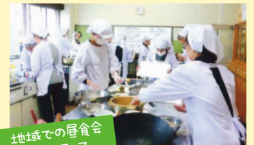
地域での昼食会ボランティア