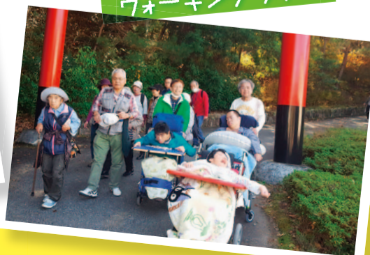
ウォーキングラリー