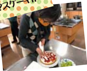
クリスマスケーキ作り